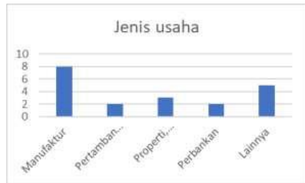
Grafik 4. Jenis Usaha

Grafik 3. menunjukkan bahwa metodologi yang paling banyak digunakan pada penelitian yang menjadi referensi bagi penulis adalah kuantitatif. Jenis usaha disajikan pada grafik 4.