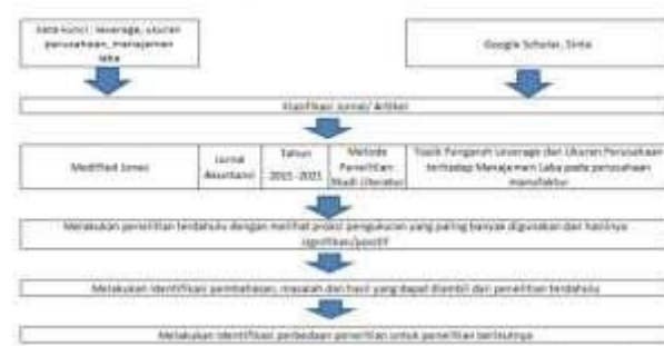
Gambar 1. Proses Pembuatan Literatur

Berdasarkan hasil dari pencarian Manajemen Laba pada Google Scholar terdapat 343.000 artikel. Variable yang digunakan berbeda-beda dalam penelitian sebelumnya, namun saat ini kami memfokuskan studi literatur pada variabel leverage dan ukuran perusahaan. Teori yang digunakan pada studi literatur sebelumnya lebih banyak menggunakan Modified Jones, sedangkan untuk sebaran tahun paling banyak dalam artikel yang digunakan dapat dilihat pada grafik 1 yaitu tahun 2020 dan 2018 dengan masing-masing 5 jurnal. Proses pembuatan literature disajikan pada gambar 1.