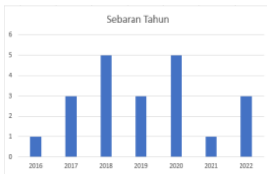
. Grafik 1. Sebaran tahun penerbitan jurnal yang dipublikasi di Sinta.

Tabel. 1 ini memberikan gambaran mengenai judul-judul, tahun, metodologi dan metode analisis dari penelitian-penelitian sebelumnya yang digunakan oleh penulis sebagai referensi. Sebaran tahun penerbitan jurnal yang dipublikasi di Sinta disajikan pada Grafik. 2.