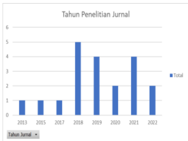
Gambar 1 Tahun Penelitian Jurnal

Mengenai tahun publikasi, Gambar 1 menggambarkan bahwa terjadi pergerakan fluktuatif jumlah makalah yang diterbitkan dari tahun 2013 ke tahun 2022. Peningkatan relatif tinggi, terjadi pada tahun 2018 dan 2021. Tren ini menunjukkan adanya minat peneliti dalam pengembangan penelitian audit operasional. Peningkatan penelitian audit operasional setelah tahun dapat disebabkan karena pentingnya peran audit operasional dalam suatu perusahaan.