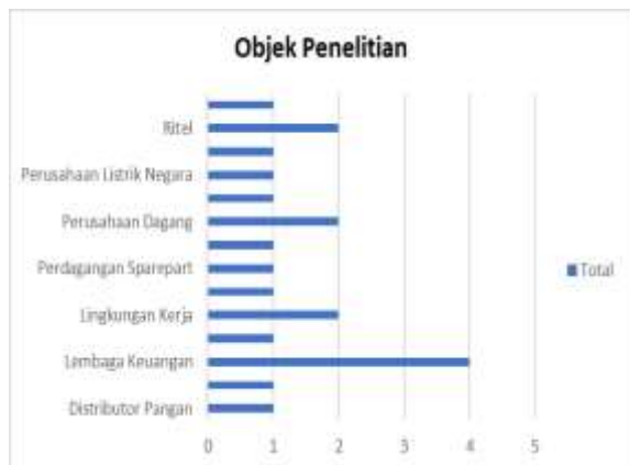
Gambar . Lingkup Studi

Berdasarkan pengujian terhadap sampel hasil penelitian yang didapat, sebesar 10 penelitian menggunakan variabel audit operasional sebagai variabel independen, sedangkan 10 penelitian lainnya menggunakan variabel audit operasional sebagai variabel independen.